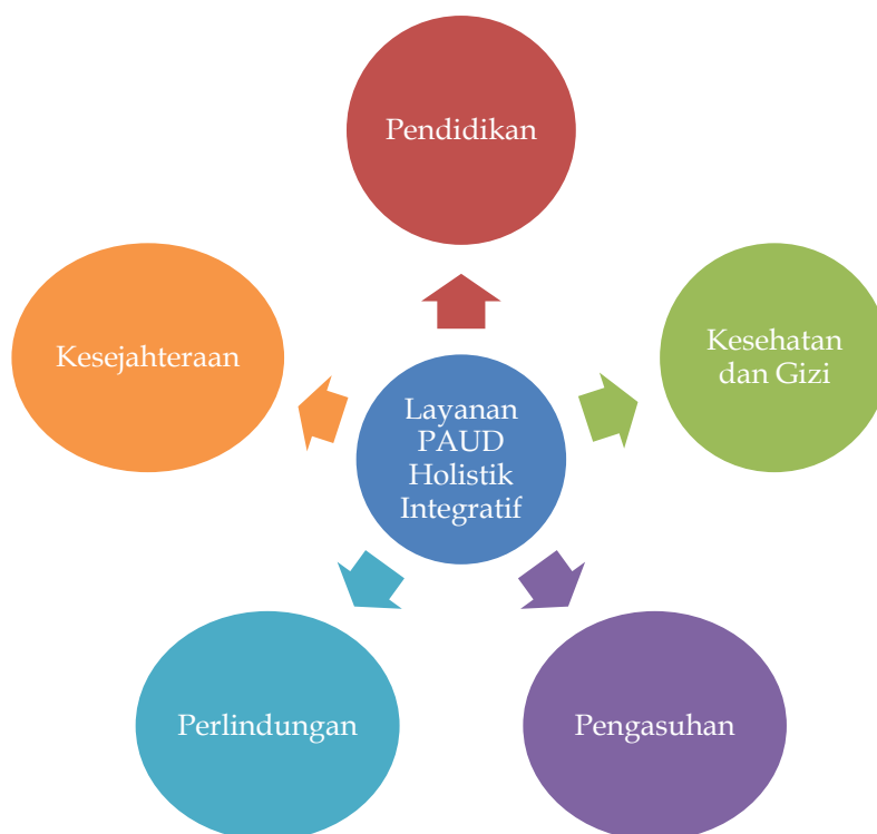
Gambar 2. Lima layanan PAUD Holistik Integratif

Wawancara yang dilakukan peneliti terhadap kepala sekolah, mengatakan bahwa ada beberapa pihak yang terkait utamanya pada penyelenggaraan PAUD holistik integratif di KB-TK Aldercy Islamic School Surakarta diantaranya adanya kerjasama dengan dinas pendidikan Kota Surakarta, Puskesmas Banyuagung Surakarta, radio PTPN Surakarta, Psikolog, Dokter Gigi, organisasi mitra Ikatan Guru Taman Kanak-kanak (IGTK), HIMPAUDI, Kelompok Kerja Guru (KKG), tokoh masyarakat, dan orang tua.