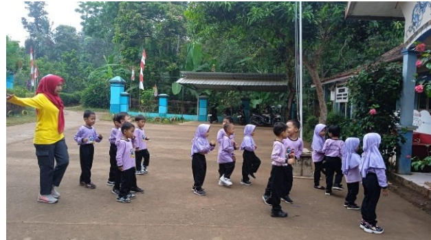
Gambar 3. Kegiatan Senam

Selanjutnya, pada perencanaan waktu akademik, evaluasi mengenai perencanaan dan jumlah jam pembelajaran dilakukan untuk memastikan bahwa setiap kegiatan mencapai kurikulum yang telah ditetapkan. Terkait perencanaan dan pemanfaatan waktu di TK Citra Kusuma Kecapi, Pembelajaran diberikan dari Senin hingga Kamis selama 150 menit, dan Jumat hingga Sabtu selama 120 menit. Jadwal harian maupun semester dirancang dengan baik untuk mendukung proses pembelajaran. Sedangkan kegiatan tambahan, seperti pembelajaran di luar kelas atau outing class , dilakukan 2-3 kali dalam satu semester. Hasilnya menunjukkan bahwa perencanaan waktu yang konsisten sangat penting untuk mencapai tujuan pendidikan nasional yaitu mencerdaskan kehidupan bangsa (Retnaningsih & Khairiyah, 2022).