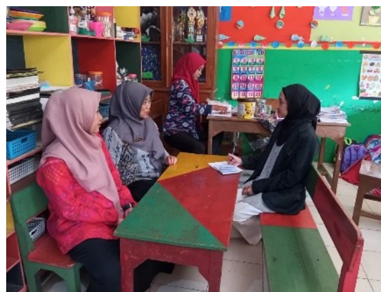
Gambar 8. Wawancara Bersama Guru