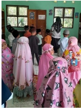
Gambar 2. Praktik Shalat

untuk belajar dan bagaimana waktu tersebut dialokasikan. Untuk mengisi waktu luang, TK Citra Kusuma Kecapi mengadakan kegiatan nonakademik seperti praktik keagamaan, senam, atau bermain bebas.