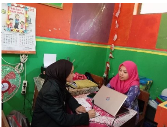
Gambar 7. Wawancara Bersama Kepala Sekolah

Pada penelitian ini menggunakan pendekatan deskriptif maka peneliti harus memaparkan data yang diperoleh melalui wawancara mendalam yang dilakukan dengan para informan. Peneliti melakukan wawancara kepada informan yaitu Kepala Sekolah, Guru, serta Orang Tua dari peserta didik TK Citra Kusuma. Berdasarkan hasil wawancara yang dilakukan, Kepala Sekolah menyatakan bahwa kebijakan standar jam kegiatan pembelajaran di TK Citra Kusuma telah mengacu pada Permendikbud Nomor 146 Tahun 2014 tentang Standar Lama Waktu Pembelajaran PAUD (TK, KB, TPA, SPS) yaitu 900 menit/minggu untuk kelompok usia 4-6 Tahun (Ulya & Mahmudah, 2023). Untuk mencapai tujuan pembelajaran yang berkualitas terkait standar kegiatan jam pembelajaran di TK Citra Kusuma maka, kebijakan Kepala Sekolah terkait jam pembelajaran di sekolah yaitu dengan menambahkan jeda istirahat yang cukup untuk menjaga fokus anak serta menyediakan waktu kegiatan non akademis seperti senam, jalan sehat, makan bersama, dan praktik-praktik keagamaan. Selain itu terdapat tantangan dalam mengatur waktu pembelajaran meliputi variasi kebutuhan anak, keseimbangan antara bermain dan belajar, serta adaptasi guru terhadap jadwal. membagi waktu secara seimbang untuk belajar, bermain, dan istirahat, serta melakukan evaluasi rutin dan melibatkan orang tua untuk mendukung keberhasilan pembelajaran.