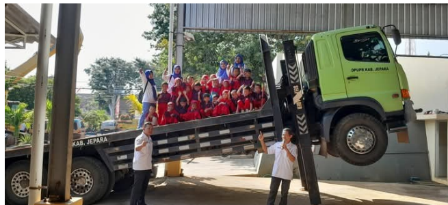
Gambar 4. Outing Class ke DPUPR Jepara

Selanjutnya, pada perencanaan waktu akademik, evaluasi mengenai perencanaan dan jumlah jam pembelajaran dilakukan untuk memastikan bahwa setiap kegiatan mencapai kurikulum yang telah ditetapkan. Terkait perencanaan dan pemanfaatan waktu di TK Citra Kusuma Kecapi, Pembelajaran diberikan dari Senin hingga Kamis selama 150 menit, dan Jumat hingga Sabtu selama 120 menit. Jadwal harian maupun semester dirancang dengan baik untuk mendukung proses pembelajaran. Sedangkan kegiatan tambahan, seperti pembelajaran di luar kelas atau outing class , dilakukan 2-3 kali dalam satu semester. Hasilnya menunjukkan bahwa perencanaan waktu yang konsisten sangat penting untuk mencapai tujuan pendidikan nasional yaitu mencerdaskan kehidupan bangsa (Retnaningsih & Khairiyah, 2022).