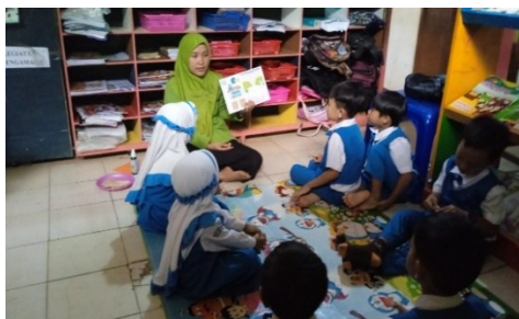
Gambar 5. Proses Inti Pembelajaran

Pada waktu yang dihabiskan dan mengerjakan tugas, anak mengerjakan tugas perkembangan selama sekitar 60 menit selama kegiatan inti pembelajaran. Kegiatan mengerjakan tugas ini menunjukkan betapa efektifnya memanfaatkan waktu untuk mencapai tujuan akademik sekolah. Penelitian ini memfokuskan terkait betapa pentingnya perencanaan dan waktu pengelolaan yang baik dan untuk keberhasilan pembelajaran. Selain itu, penelitian ini mencakup Academic Learning Time atau waktu belajar akademik, yaitu waktu di mana anak-anak terlibat dalam kegiatan akademik. Kegiatan akademik seperti mengerjakan tugas perkembangan menunjukkan bahwa aktivitas akademik adalah komponen penting dari pembelajaran (Tanjung et al., 2019).