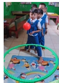
Gambar 6. Kegiatan Motorik Kasar