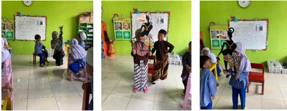
Gambar. 1 mendongeng dengan wayang kulit