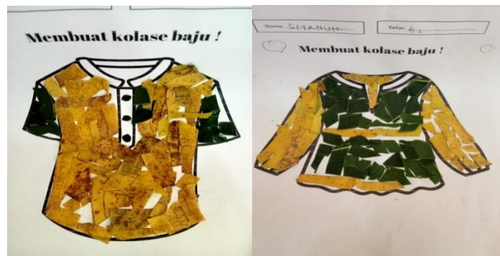
Gambar 4. Hasil Kolase dari Bahan Daun