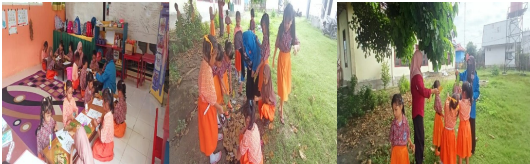
Gambar 3. Proses Anak-Anak Mencari Bahan Daun di Lingkungan Sekolah

Kolase daun yang dilakukan anak selama 2 minggu mengalami perubahan kemampuan kreativitas anak usia dini sesuai dengan yang diharapkan oleh guru dan peneliti. Metode yang diterapkan melalui kegiatan kolase terbukti efektif dalam meningkatkan kreativitas pada anak usia dini. Contohnya, anak dapat menghasilkan kolase menggunakan daun dengan ide yang berbeda dan kreatif. Pengamatan selama penelitian menunjukkan bahwa anak-anak yang biasanya menempelkan kolase menjadi lebih tertarik dalam menempel menggunakan bahan daun.