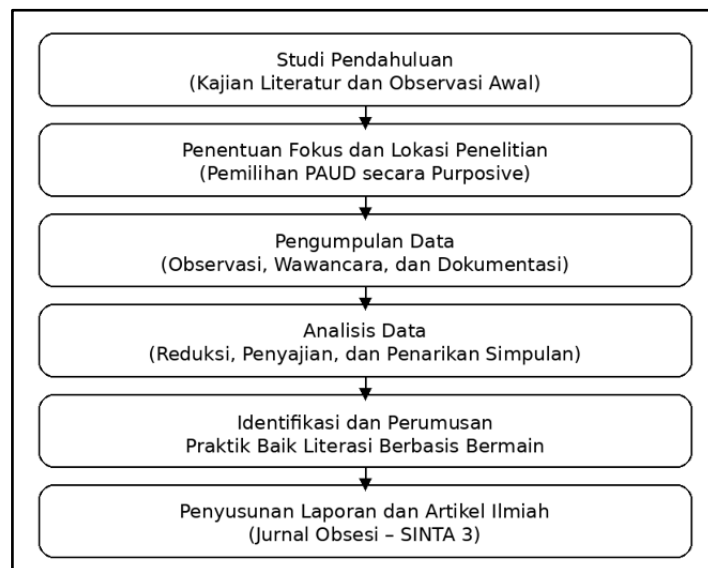
Gambar 1. Bagan Alir Praktik Baik Pembelajaran Literasi Awal Anak Usia Dini melalui Kegiatan Bermain

Peneliti berperan sebagai instrumen utama dan hadir langsung di lokasi penelitian untuk mengamati proses pembelajaran. Kehadiran peneliti bersifat nonintervensif agar kegiatan bermain literasi berlangsung secara natural sesuai dengan praktik pembelajaran yang dirancang oleh guru. Penelitian dilaksanakan selama kurang lebih enam minggu, meliputi tahap observasi awal, pengumpulan data utama, dan verifikasi data.