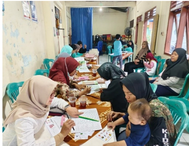
Gambar 1. Pelaksanaan Parenting Kebangsaan

Berdasarkan keterangan An selaku konsultan Parenting Kebangsaan, kegiatan posyandu sering kali tidak hanya dihadiri oleh orang tua yang memiliki anak balita, tetapi juga dicampur lansia yang masih termasuk dalam lingkup kegiatan posyandu. Ada posyandu balita dan lansia, terkadang di kondisi tertentu, posyandu ini melakukan satu kegiatan sekaligus. Hal tersebut membuat suasana posyandu menjadi ramai sehingga proses edukasi kepada orang tua menjadi kurang kondusif. Berdasarkan temuan penulis, orang tua yang mendapatkan SiKumbang tidak memonitor perkembangan anak setiap bulannya karena tidak hadir pada saat hari posyandu. Hal ini sesuai dengan penjelasan Sa selaku orang tua yang tidak memberi tanda centang SiKumbang karena tidak tahu cara menggunakan SiKumbang. Pada saat kegiatan posyandu, Sa tidak hadir karena bekerja, dan anak dibawa ke posyandu oleh neneknya, sehingga tujuan program ini tidak tersampaikan langsung kepada orang tua. Selain itu, Ni selaku orang tua juga mengaku tidak mengisi SiKumbang karena tidak memahami penggunaan SiKumbang. Tingkat pemahaman yang berbeda pada setiap orang tua memengaruhi implementasi penggunaan SiKumbang di rumah. Berikut tampilan SiKumbang yang berisi tugas perkembangan anak dan pesan/rekomendasi untuk orang tua yang dihitung per bulan, yaitu dari 1 hingga 60 bulan.