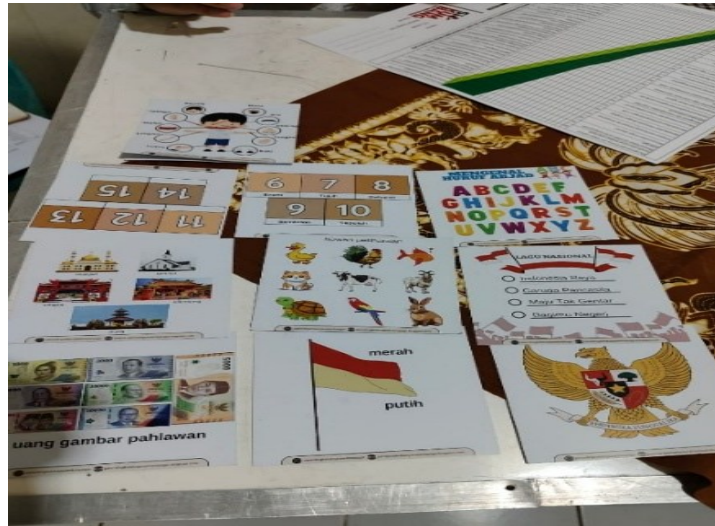
Gambar 3. Flash Card Kebangsaan

itu, konsultan parenting kebangsaan juga memiliki flash card yang digunakan untuk menstimulasi pengetahuan dan wawasan kebangsaan anak. Konsultan menanyakan anak terkait gambar-gambar yang ada di flash card kebangsaan. Flash card kebangsaan diharapkan dapat membantu orang tua memberikan rangsangan terkait nilai-nilai kebangsaan kepada anak. Berikut adalah gambar flash card yang digunakan konsultan parenting kebangsaan untuk mengedukasi orang tua dalam mengenalkan wawasan kebangsaan kepada anak. Flash card kebangsaan adalah kartu yang memuat gambar-gambar untuk membantu anak mengenal dan melihat langsung bentuk-bentuk tertentu, seperti gambar berikut.