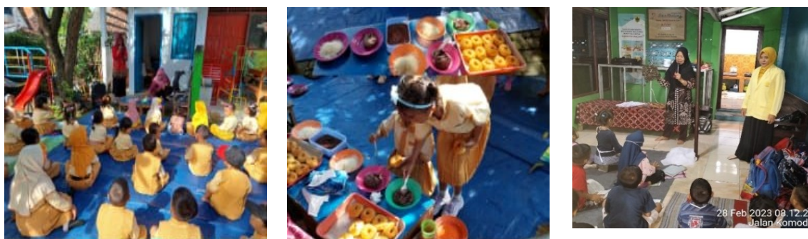
Gambar 3. Kegiatan pembelajaran literasi numerasi bermitra dengan keluarga

Peserta didik diajak membuat donat dengan arahan dari narasumber yang dibantu oleh guru. Peserta didik diajarkan untuk menimbang berat tepung, membentuk adonan dan menghias donat yang sudah jadi. Dalam proses pembelajaran yang dilakukan, anak diajarkan bagaimana menimbang berat benda, berapa jumlah yang dibutuhkan, bagaimana anak dapat menyelesaikan membuat donat secara runtut dan benar. Anak-anak diajak untuk berkreasi menghias donat yang mereka buat sendiri.