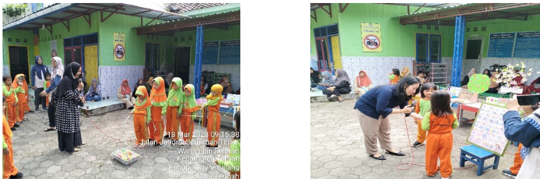
Gambar 4. Kegiatan pelibatan keluarga dalam pembelajaran

mendampingi anak membacakan buku cerita dan kegiatan sesuai dengan kebutuhan anak dalam hal ini literasi numerasi (gambar 4).