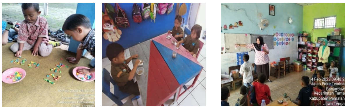
Gambar 2. Implementasi pembelajaran literasi numerasi

Hasil observasi pembelajaran literasi numerasi dan media pembelajaran yang digunakan di satuan pendidikan ditemukan fakta bahwa pembelajaran literasi numerasi dalam pembelajaran sudah memanfaatkan bahan nyata, bukan hanya lembar kerja yang digunakan. Hal ini dapat dilihat dari gambar 2.