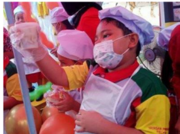
Gambar 2. Praktek wirausaha

Berdasarkan responden A, B, dan C dapat disimpulkan bahwa penanaman kebiasaan dan pengenalan sejak dini makna dari keberhasilan , kewirausahaan, dan kegagalan dalam berbisnis sudah mulai ditunjukkan oleh para orang tua sejak dini. Hal ini sesuai pendapat (Pinho, M. I., dkk 2019) bahwa kewirausahaan mampu memberikan tanggung jawab dan kekuatan anak untuk menganalisis suatu masalah, kreatif dan mencari suatu penyelesaiannya secara komprehensif dan berhati-hati dalam melangkah, tidak muda menyerah dan mengatur tujuan akhir.