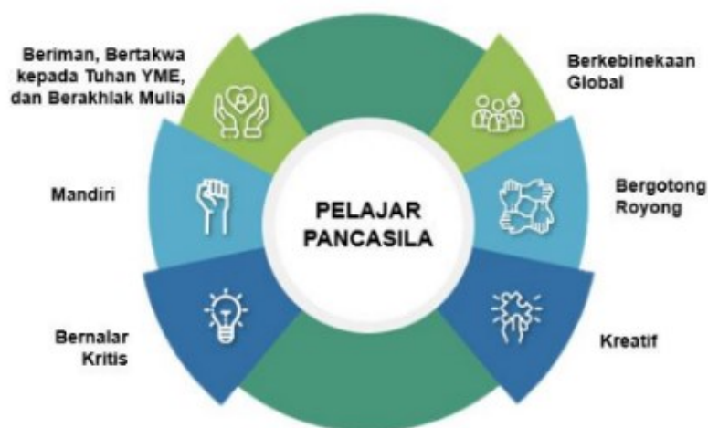
Gambar 1. Profil Pelajar Pancasila

Peraturan Menteri Pendidikan dan Kebudayaan Nomor 22 Tahun 2020 tentang Rencana Strategis Kementerian Pendidikan dan Kebudayaan Tahun 2020-2024. Keenam profil tersebut sebagaimana tergambar pada gambar 1.