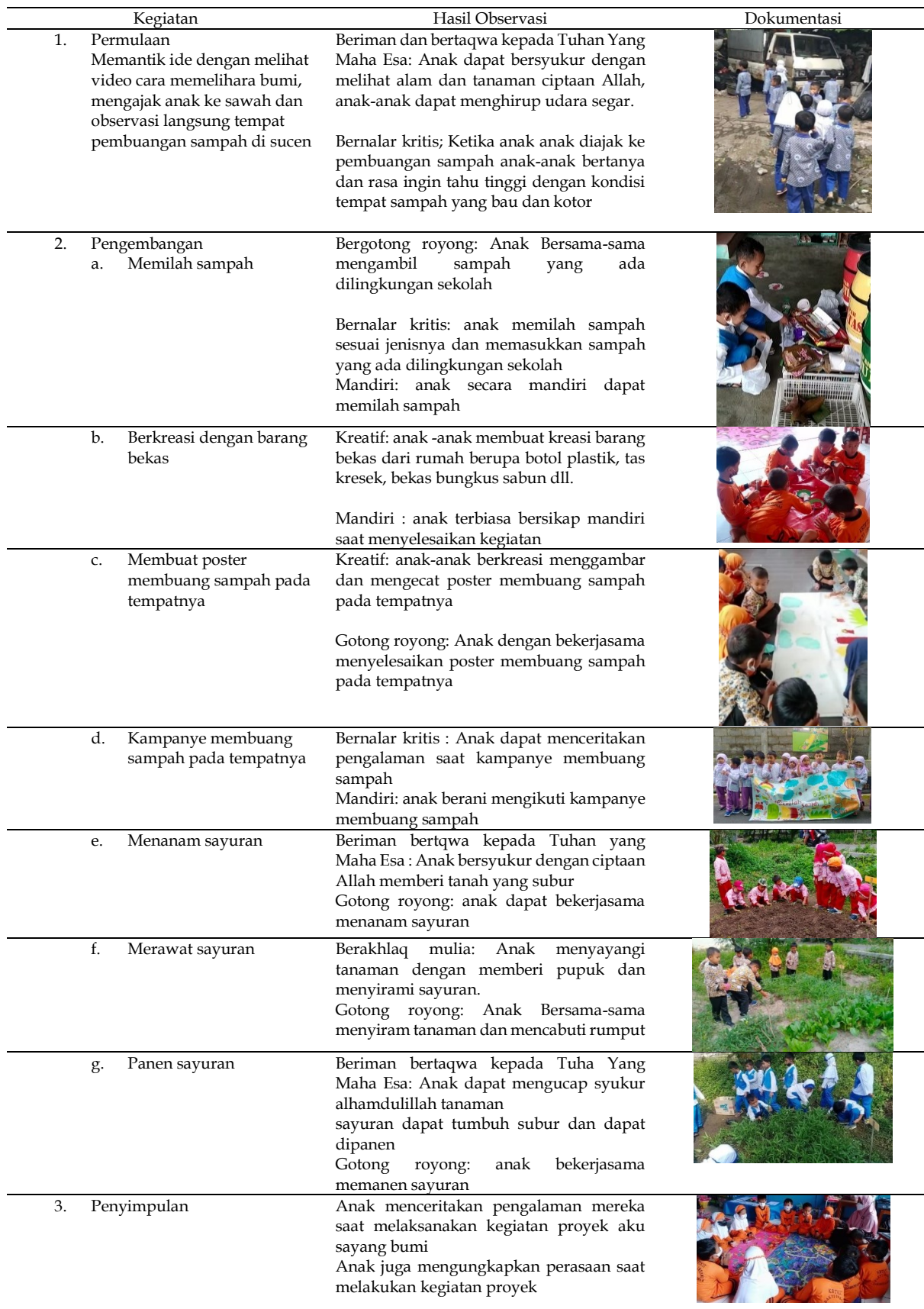
Tabel 1. Implementasi Penguatan Profil Pelajar Pancasila melalui Pembelajaran Berbasis Proyek dengan Topik Aku Sayang Bumi