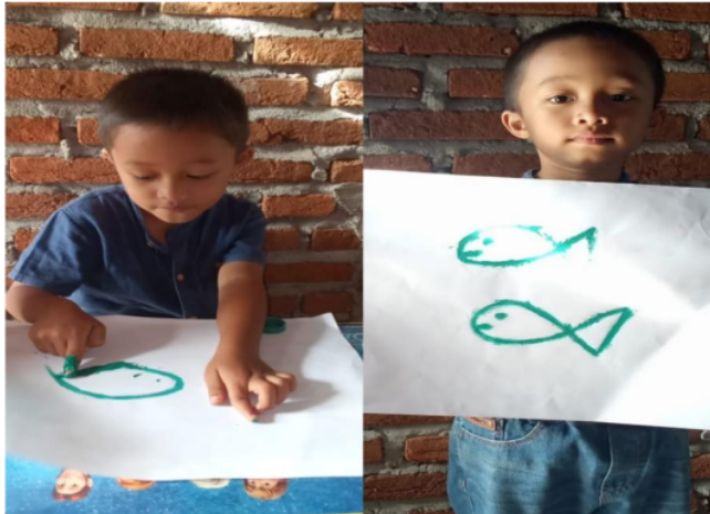
Gambar 2. Kegiatan finger painting dengan tema ikan.

Pada gambar di atas di mana kegiatan finger painting sedang berjalan pada gambar terlihat bahwa anak sedang menggambar menggunakan jari tangan di mana anak terlihat sangat lihai dalam menggambar menggunakan Teknik tersebut ini menunjukkan bahwa anak mampu menerapkan teknik finger painting serta teknik ini juga membantu dalam pengembangan motoric halus anak.