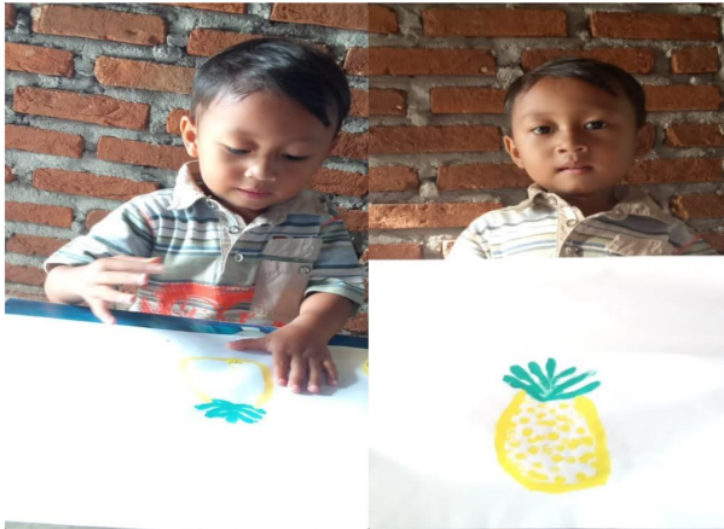
Gambar 3. Kegiatan finger painting dengan tema buah nanas

lurus kecil sebagai daun nanas ".setelah guru menjelaskan dan mencontohkan gambar anak di suruh mengikuti langkah-langkah yang diberikan guru dan guru membimbing anak satu per satu saat proses menggambar buah nanas menggunakan jari tangan mereka.