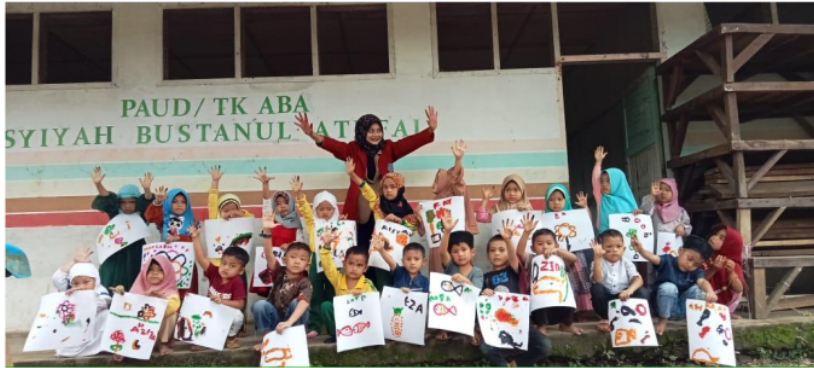
Gambar 4. Foto bersama setelah melakukan kegiatan finger painting .

Penilaian terhadap anak didik dilakukan dengan teratur dan berkelanjutan (Farida dkk., 2022), sehingga penilaian merupakan aktivitas penting dalam program di TK Asyiyah Bustanul Athfal. Hal ini didasarkan pada hasil pengamatan dan interaksi dengan informan yang telah dilakukan oleh peneliti dalam mengaplikasikan teknik finger painting untuk memperkuat kemampuan motorik halus anak. Guru dan peneliti melakukan evaluasi belajar untuk menentukan tingkat perkembangan motorik halus anak setelah menerapkan teknik finger painting . Semasa pelaksanaan belajar mengajar, guru dan peneliti memantau anak yang mampu menggunakan jari-jarinya dengan baik saat melakukan finger painting . Mereka juga memperhatikan perkembangan anak selama proses belajar, serta memantau aktivitas jari-jari anak setelah melakukan kegiatan finger painting .