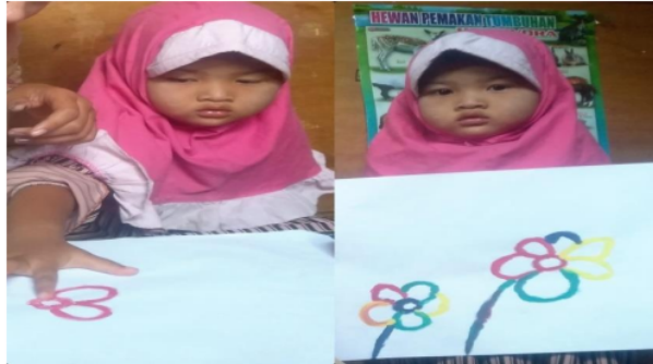
Gambar 3. Kegiatan finger painting dengan tema bunga

untuk menjadi batang dari bunga ".setelah guru menjelaskan dan mencontohkan gambar anak di suruh mengikuti langkah-langkah yang diberikan guru dan guru membimbing anak satu per satu saat proses menggambar bunga menggunakan jari tangan mereka.