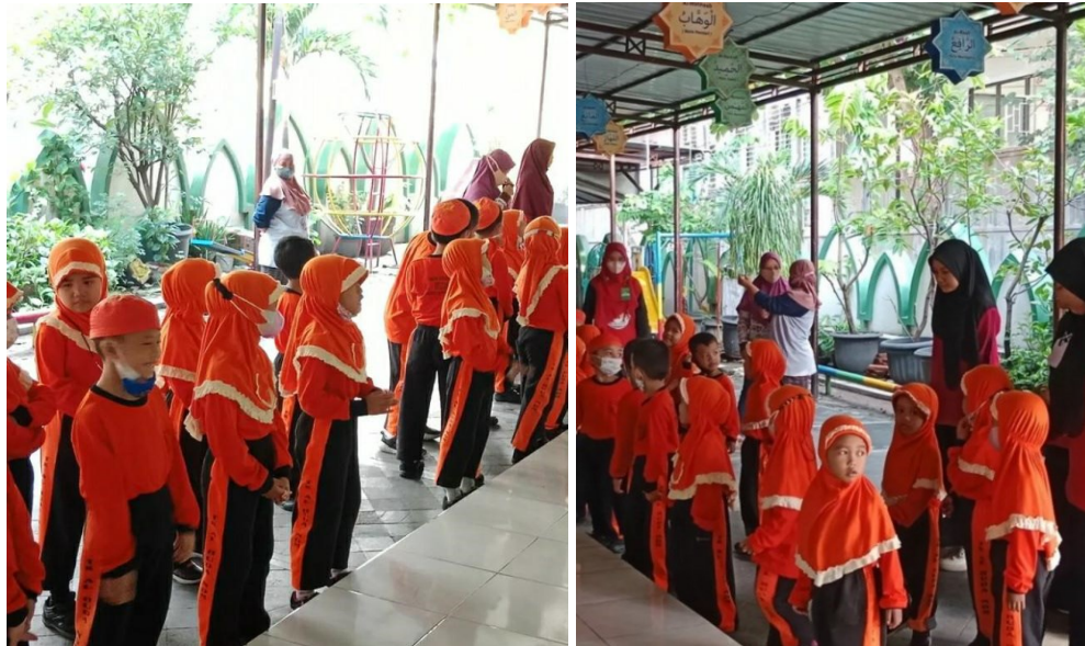
Gambar 2. Suasana Kegiatan Tari

Peneliti mengamati anak dengan kemampuan motorik kasar dengan melakukan kegiatan menari seperti anak sudah mampu melompat dan berjalan maju ke depan dengan lurus, beberapa anak juga sudah bisa membedakan antara melompat dan meloncat, anak juga mampu merentangkan tangan ke samping dan kedepan sambil mengayunkan lengan, dan yang terakhir anak mampu maju ke depan dengan satu kaki diiringi dengan tepuk kedua tangan. Suasana kegiatan tari di TK Al Huda Laweyan Surakarta terdapat pada gambar 2.