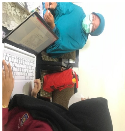
Gambar 2. Kegiatan Wawancara dengan Guru Kelas

Berdasarkan hasil wawancara setelah dilakukannya storytelling , guru menyebutkan bahwa yang sebelumnya anak terlihat enggan berbagi dengan temannya setelah dilakukannya storytelling anak sudah mulai mau berbagi. Perbedaan yang terlihat sebelum dan sesudah kegiatan storytelling yaitu guru mengatakan perbedaannya sangat terlihat, jika sebelum dilakukannya storytelling , anak belum mengetahui mengenai sikap sosial diantaranya sikap tolong menolong, maka setelah penerapan storytelling anak mendapatkan pengetahuan tentang sikap tolong menolong sesuai dengan cerita rakyat yang sedang dibacakan dalam storytelling tersebut. Tidak hanya itu anak juga mencoba menerapkan pengetahuan yang mereka dapat dalam kehidupan sehari-hari, guru menyebutkan terjadi perubahan perilaku yang dilakukan oleh anak. Dalam kegiatan wawancara itu guru juga mengatakan anak mau berbagi makanan yang dibawanya kepada temannya. Selain itu guru juga menyebutkan bahwa sikap kooperatif anak sudah mulai muncul pada saat kegiatan berkelompok. Kegiatan wawancara dapat dilihat pada gambar 2.