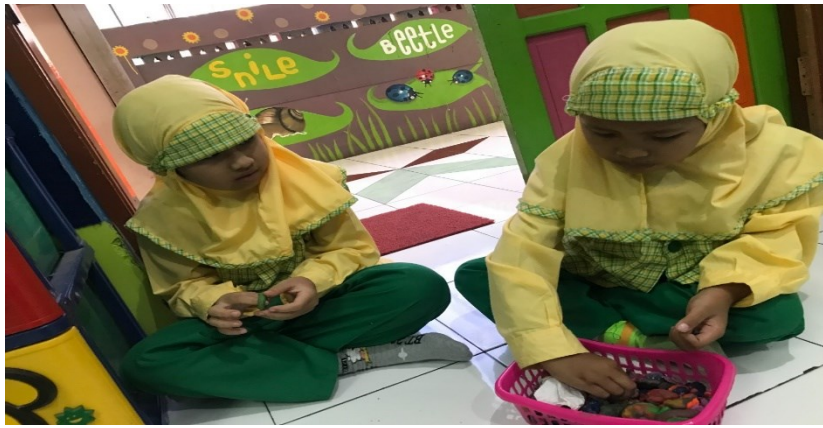
Gambar 3. Anak dapat berbagi mainan dengan teman (Kemunculan Karakter pada Anak )