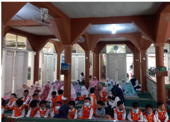
Gambar 2. Menyanyi lagu Islami bersama sebelum sholat dhuha

pembelajaran. Kegiatan keislaman pagi hari dilakukan sebelum anak-anak sholat dhuha bersama. Selanjutnya pada pembukaan pembelajaran sebagai bentuk penyegaran bagi anak didik dan juga pada penutupan pembelajaran agar anak terbiasa. Kegiatan tersebut tidak terlepas dari program penanaman nilai-nilai agama (religius) dan moral yang menarik dan menyenangkan bagi anak seperti terdapat pada gambar 2.