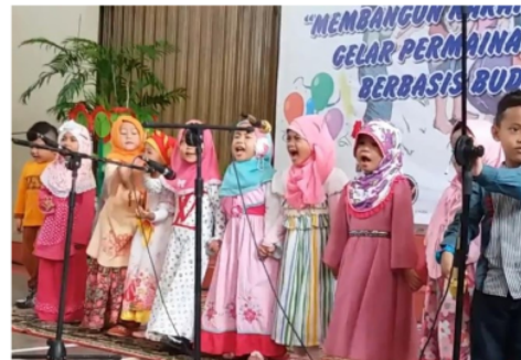
Gambar 5. Pentas menyanyi lagu doa naik kendaraan

Gambar 4. merupakan kegiatan lomba atau kompetisi yang dilakukan oleh peserta didik. Aktivitas pada gambar di atas bertujuan untuk melatih kemampuan anak dalam kegiatan menyanyi, melatih sikap percaya diri anak untuk dapat tampil di depan umum,