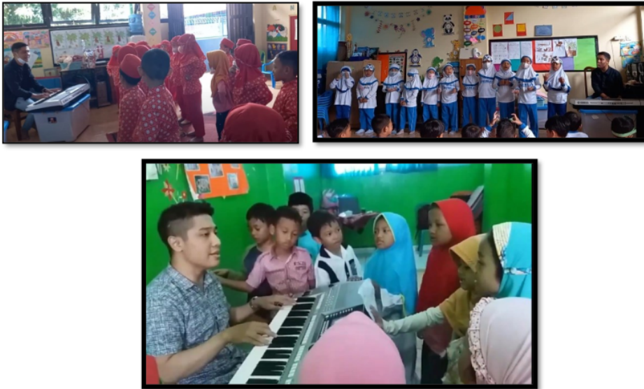
Gambar 3. Kegiatan ekstrakurikuler menyanyi

menyanyi dengan cara yang baik dan benar. Kemudian guru mengajak dan memberikan kesempatan waktu untuk berdiskusi mengenai keterangan isi dan makna lagu yang diajarkan kepada anak-anak seperti terdapat pada gambar 3.