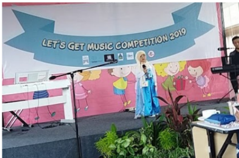
Gambar 4. Mengikuti lomba menyanyi

Gambar 3. menunjukkan kegiatan pengembangan diri menyanyi yang sedang berlangsung di ruang kelas maupun ruang ekstrakurikuler. Terdapat guru ekstrakurikuler dan anak-anak yang sedang berlatih menyanyi menggunakan iringan alat musik yaitu keyboard atau piano dengan menyanyikan lagu-lagu islami. Kegiatan tersebut adalah bentuk penanaman nilai-nilai agama (religious) melalui Lagu Islami yang disampaikan dalam pembelajaran yang menarik dan menyenangkan bagi anak. Di sisi lain, kegiatan tersebut juga turut serta dalam proses pengembangan bakat anak, khususnya pada bakat olah vokal anak untuk dapat menyanyi secara baik dan percaya diri tampil unjuk bakat yang dimiliki.