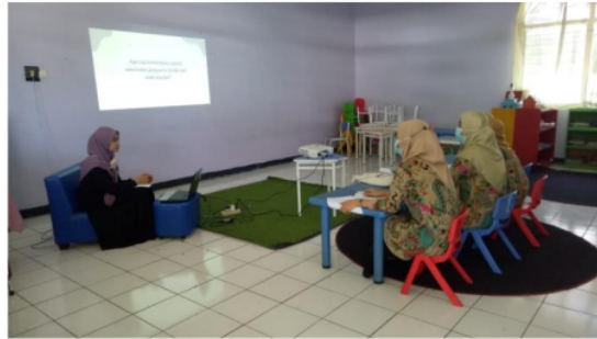
Gambar 2. Pelaksanaan Wawancara dan Focus Group Discussion (FGD)

pada hari senin tanggal 08 Agustus 2022 di TK Laboratorium Kampus UPI di Cibiru. Berikut salah satu dokumentasi dari kegiatan wawancara dan focus group discussion (FGD) yang telah dilaksanakan.