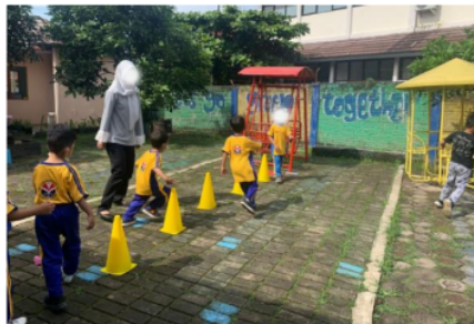
Gambar 3. Kegiatan Olahraga Lari Zig-Zag Kiri-Kanan dalam Pengembangan Spatial Awareness Anak

Guru 3 mengungkapkan bahwa kegiatan senam yang dilakukan oleh anak tak jarang diiringi juga dengan musik atau lagu. “Kalau kegiatan pembelajaran di kita biasanya ada lagu senam yang rentangan tangan ke kanan dan ke kiri. Ya biasanya dengan senam atau olahraga, gerakan lagu, menari, kaya gitu bisa...” ungkap Guru 2. Selain senam, terdapat kegiatan olahraga yang dilakukan oleh anak berdasarkan arahan dari guru. Adapun contoh dari kegiatan olahraga yang dilakukan sebagai upaya pengembangan spatial awareness anak dapat ditunjukkan pada gambar berikut: