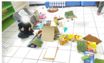
Gambar 4. Kegiatan Anak Bermain dengan Menggunakan Media Loose Parts

Guru 1 mengungkapkan bahwa “...Anak bisa mengenal jarak, arah, tekstur, dan warna..”. Pernyataan tersebut menunjukkan bahwa melalui bermain dengan menggunakan media loose parts guru di TK Laboratorium Kampus UPI di Cibiru dapat berupaya untuk mengembangkan spatial awareness yaitu terkait konsep jarak dan arah. Selain itu, Guru 3 juga mengungkapkan bahwa melalui media loose parts anak akan banyak mengenal bentuk. Hal ini karena loose parts memiliki bentuk yang beragam (Daly & Beloglovsky, 2014; Siantajani, 2020). Menurut Guru 3, melalui kegiatan bermain dengan menggunakan media loose parts , anak juga diarahkan memahami instruksi terkait dengan posisi benda seperti di atas, di bawah, di antara, dan lain sebagainya. Hal ini tentunya mendukung bagi anak untuk memiliki spatial awareness .