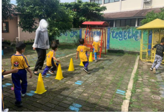
Gambar 3. Kegiatan Olahraga Lari Zig-Zag Kiri-Kanan dalam Pengembangan Spatial Awareness Anak

Guru 3 mengungkapkan bahwa kegiatan senam atau olahraga. Kegiatan senam yang dilakukan oleh anak tak jarang akan diiringi juga dengan musik atau lagu. “Kalau kegiatan pembelajaran di kita biasanya ada lagu senam yang rentangan tangan ke kanan dan kekiri. Ya biasanya dengan senam atau olahraga, gerakan lagu, menari, kaya gitu bisa...” ungkap Guru 2. Selain senam, terdapat kegiatan olahraga yang dilakukan oleh anak berdasarkan arahan dari guru. Adapun contoh dari kegiatan olahraga yang dilakukan sebagai upaya pengembangan spatial awareness anak dapat ditunjukkan pada gambar berikut: