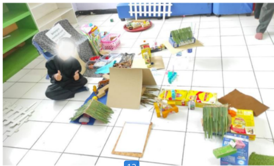
Gambar 3. Kegiatan Anak Bermain dengan Menggunakan Media Loose Parts

Guru 1 mengungkapkan 32 bahwa "...Anak bisa mengenal jarak, arah, tekstur, dan warna..". Pernyataan tersebut menunjukkan bahwa melalui bermain dengan menggunakan media loose parts guru di TK Laboratorium Kampus UPI di Cibiru dapat berupaya untuk mengembangkan spatial awareness yaitu terkait konsep jarak dan arah. Selain itu, Guru 3 juga mengungkapkan bahwa melalui media loose parts anak akan banyak mengenal bentuk. Hal ini karena loose parts memiliki bentuk yang beragam 12 (Daly & Beloglovsky, 2014; Siantajani, 2020). Menurut Guru 3, melalui kegiatan bermain dengan menggunakan media loose parts, anak juga diarahkan memahami instruksi terkait dengan posisi benda seperti di atas, di bawah, di antara, dan lain sebagainya. Hal ini tentunya mendukung bagi anak untuk memiliki kemampuan spatial awareness.