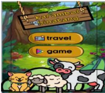
Gambar 1. Tampilan awal media game animal karambol

Pada gambar 1 merupakan gambar menu pertama yang bertujuan untuk menarik perhatian anak dalam mengikuti game animasi karambol. Sedangkan pada pada gambar 2 diatas merupakan tampilan menu yang terdiri dari menu tombol hewan yang hidup di darat, air, udara, dan hewan yang hidup di dua alam. Tampilan menu ini di sesuaikan dengan karakteristik anak-anak usia dini yang ada muatan habitat hewan di alam terbuka.