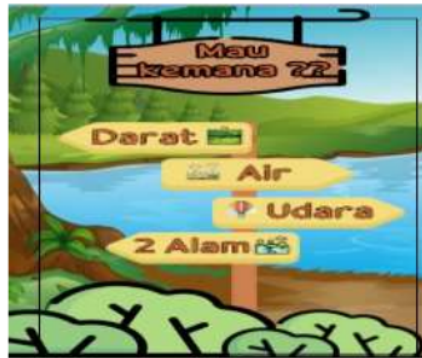
Gambar 2 tampilan menu