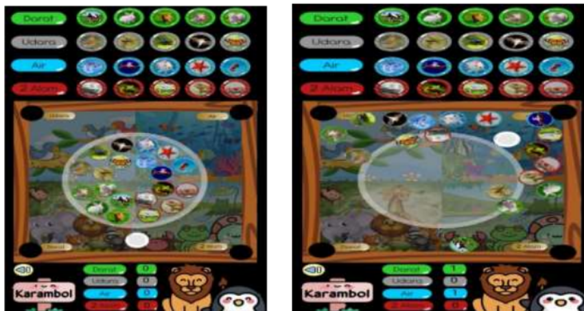
Gambar 3 tampilan game animasi animal karambol

Pada gambar 3 merupakan tampilan game animasi karambol yang terdiri dari beberapa jenis hewan yang tinggal di beberapa alam, yang di sesuaikan dengan karakteristik anak usia dini.