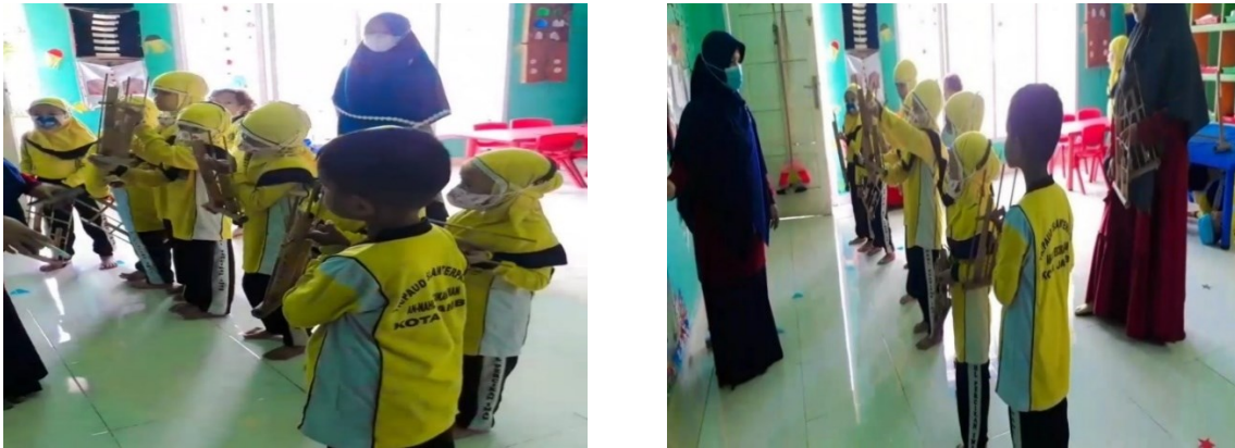
Gambar 2. Anak melakukan permainan angklung secara bersama-sama

memaksimalkan interaksi positif anak dengan anak yang lainnya maka dibutuhkan permainan yang pelaksanaannya secara berkelompok.