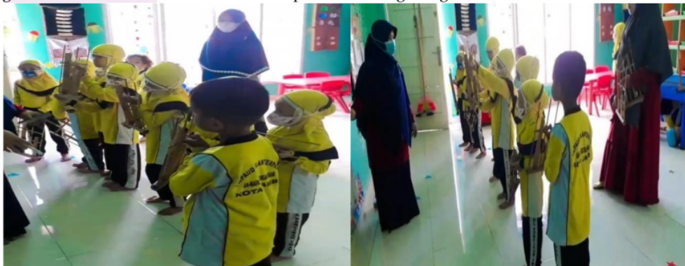
Gambar 2. Anak melakukan permainan angklung secara bersama-sama

Pada penelitian ini, proses pelaksanaan permainan angklung, terlebih dahulu guru memberikan aturan saat bermain angklung, kemudian guru membagikan angklung kepada masing-masing anak dan membuat barisan sesuai angka yang sudah di tempel pada angklung. Selanjutnya, guru mengajak anak untuk bermain angklung menggunakan sebuah lagu dengan cara menggerakkan jari tangannya, contohnya seperti not angka 1 (do) maka jari tangan guru yang terbuka hanya satu, begitu pun dengan nada yang lain. Kegiatan ini dilakukan secara berulang ulang oleh anak-anak, secara otomatis komunikasi anak satu dengan yang lainnya terjalin dengan baik. Anak-anak bekerja sama dalam permainan angklung, mengingatkan dan memberitahukan kepada temannya apabila masih ada yang belum maksimal dalam menggunakan angklung. Untuk lebih jelasnya dapat dilihat pada gambar berikut, cara anak memainkan permainan angklung.