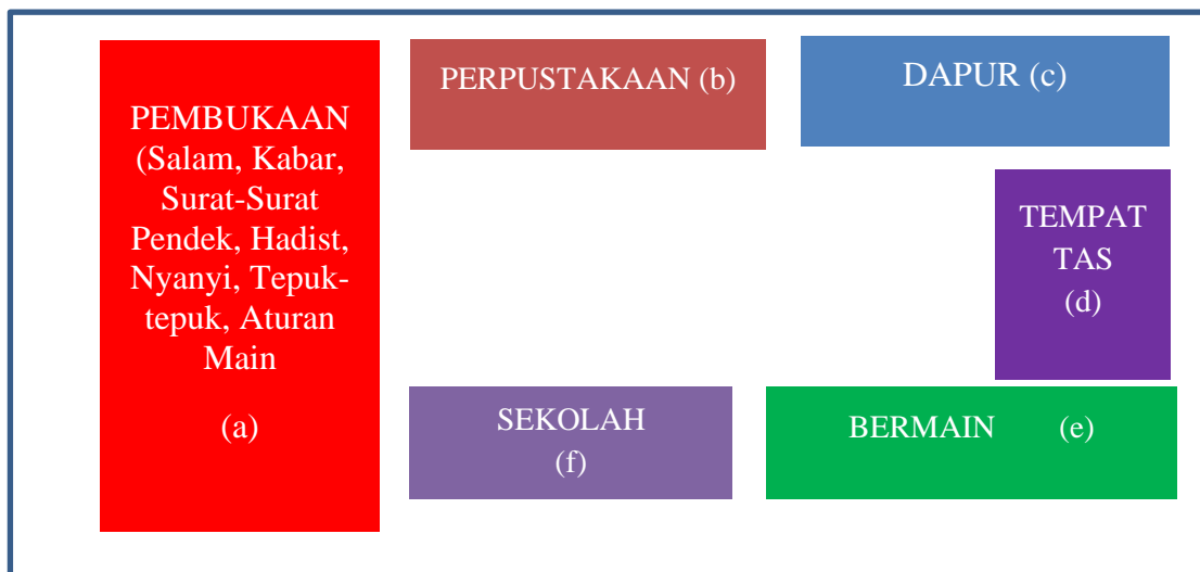
Gambar 2. Desain Pembelajaran Sentra Main Peran

Pembelajaran sentra sebagaimana Khasan Ubaidillah merupakan model pembelajaran yang paling mutakhir diterapkan pada pendidikan anak usia dini (Ubaidillah, 2018). Karakteristik pembelajaran sentra ialah diberikannya pijakan untuk mengatur konsep, ide, pengetahuan, dan intensitas bermain anak (Mulyasa, 2014). Selanjutnya, menurut Lestarini mengatakan pembelajaran sentra berpusat pada sentra-sentra (Lestarini, 2013). Definisi tersebut senada dengan desain pembelajaran sentra main peran di Kelompok B di RA Tiara Chandra. Desain tersebut sebagaimana observasi di Kelompok B di RA Tiara Chardra dapat dilihat gambar 2.