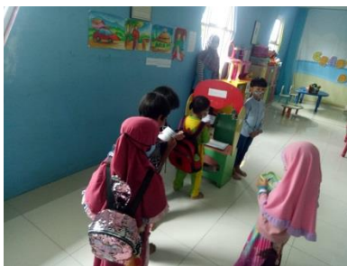
Gambar 5. Anak Berperan sebagai penjaga perpustakaan dan meminjam buku

Pijakan saat main anak-anak melakukan kegiatan main sebagaimana yang dipilih sebelum kegiatan main. Kegiatan main tersebut dilakukan secara bersamaan, sehingga tidak ada anak yang ngnggur. Anak-anak merasakan semua kegiatan main. Oleh karenanya, anak-anak bergantian bermain peran. Ada anak berperan penjaga perpustakaan, anak berperan menjadi fasilitator, anak berperan menjadi murid, anak berperan menjadi orang tua dan lain-lain. Hal ini sebagaimana gambar 5-7.