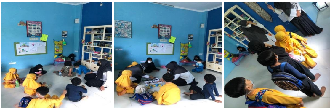
Gambar 8. Kegiatan penutup

Kegiatan penutup pada sentra main peran diisi dengan bernyanyi, tepuk-tepuk, doa kedua orang tua, doa kebaikan dunia dan akhirat, doa selesai belajar, membaca surah Al-Ashr, doa keluar rumah dan naik kendaraan. Sebelum anak-anak berpamitan, fasilitator menyampaikan pesan, nasihat, ucapan terima kasih, permohonan maaf kepada anak-anak dan ditutup dengan salam. Gambaran pelaksanaan kegiatan penutup disajikan dengan gambar 8.