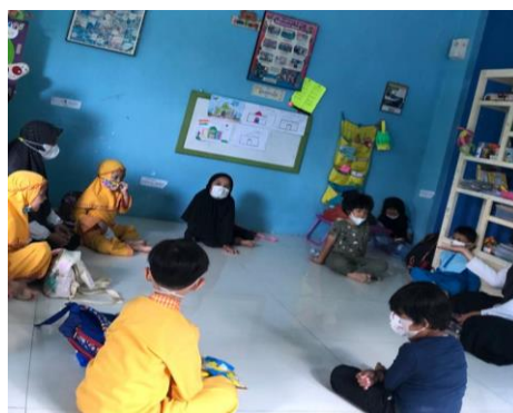
Gambar 4. Kegiatan Pagi

Pukul 09.15 WIB - 09.30 WIB kegiatan pembukaan dimulai. Pada kegiatan pembukaan fasilitator mengumpulkan anak-anak untuk duduk melingkar, menanyakan kabar, mengabsen anak. Anak-anak juga diminta untuk menghafalkan surat-surat pendek, asmaul husna, doa sehari-hari, dan hadist. Selain itu, fasilitator juga mengenalkan berbagai kosa kata sesuai dengan tema kegiatan menggunakan bahasa Indonesia, bahasa Jawa, Inggris, dan bahasa Arab. Kegiatan pagi dapat dilihat sebagaimana gambar 4.