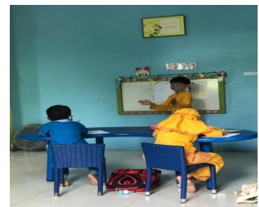
Gambar 7. Anak Berperan sebagai fasilitator dan murid

Pijakan saat main ini fasilitator memberikan waktu kurang lebih 60 menit. Ketika anak-anak bermain, fasilitator mengamati kegiatan main setiap anak, memberikan motivasi kepada anak untuk menyelesaikan semua kegiatan, dan mencatat pencapaian perkembangan anak.