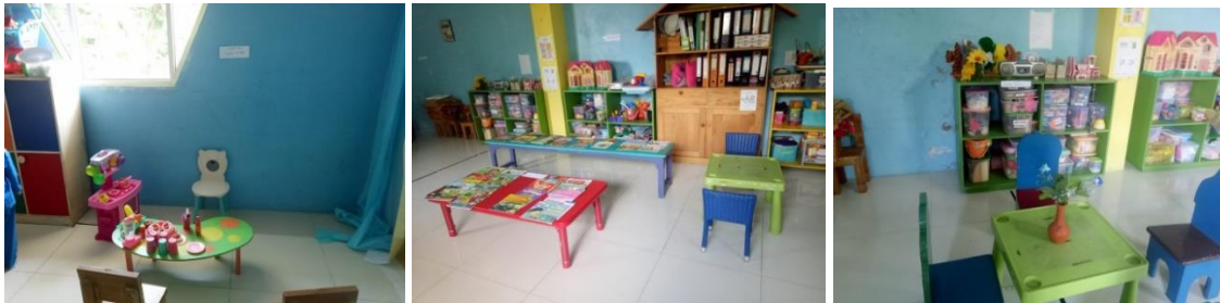
Gambar 3. Setting Sentra Main Peran

Kegiatan pembuka dimulai pukul 09.00 WIB sampai 09.15 WIB. Namun sebelum kegiatan pagi dimulai, fasilitator menyiapkan kegiatan main peran di kelas dengan tema "sekolahan" berupa mengatur tempat-tempat, meja, alat tulis, kursi, vas bunga, buku, rak buku, buku bergambar, kartu perpustakaan, lego, replica, alat-alat masak dan lain-lain. Tentunya, dalam mengatur kelas menyesuaikan tema kegiatan pembelajaran sentra main peran. Setting sentra main peran disajikan pada gambar 3.