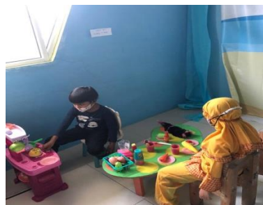
Gambar 6. Anak Berperan sebagai ayah (memasak) dan anak (sarapan)