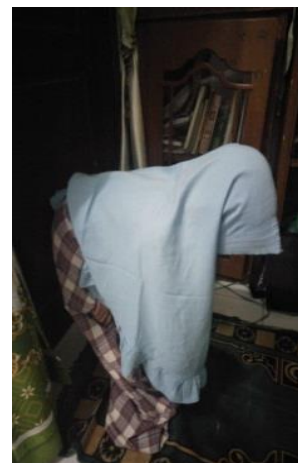
Gambar 3. Shalat Subuh (dokumentasi penelitian)