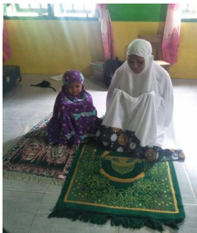
Gambar 2. Shalat Dzuhur

Berdasarkan hasil observasi juga ditemukan bahwa anak usia dini yang merupakan anak dari informan berinisial IM melaksanakan shalat lima waktu, dan orang tua membekali anak mengenai pendidikan agama serta prakteknya. Informan IM selalu melaksanakan shalat lima waktu, baik di rumah maupun di ladang sehingga hal tersebut menjadi contoh nyata penanaman perilaku ibadah shalat lima waktu bagi anaknya yang berusia 5 tahun. Hasil observasi juga didukung dengan hasil dokumentasi ketika informan berinisial IM dan anaknya sedang melaksanakan shalat dzuhur. Dokumentasi ini diambil atas izin informan dan anaknya sebelum mereka melaksanakan shalat dzuhur dan sholat subuh pada gambar 2 dan 3.