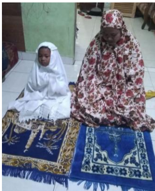
Gambar 4. Shalat Maghrib berjamaah (dokumentasi penelitian)

shalat Maghrib, Isya ataupun Dzuhur jika memang orang tua sempat untuk pulang ke rumah pada siang hari. Peneliti berkunjung ke beberapa rumah informan pada hari Minggu tanggal 17 dan 24 Oktober 2021, kemudian mengambil dokumentasi mengenai pelaksanaan ibadah shalat lima waktu. Dari beberapa rumah yang didatangi, dan dari beberapa dokumentasi yang diambil maka hanya tiga foto yang dipilih untuk menggambarkan pola asuh orangtua dalam menanamkan perilaku ibadah shalat lima waktu pada anaknya di masa pandemi. Pada gambar 4 terlihat bahwa orang tua (ibu) melaksanakan shalat Maghrib berjamaah dengan anak perempuannya yang masih berusia 5 tahun. Anak mengikuti gerakan shalat yang ibu lakukan, kemudian ikut berdoa untuk meminta sesuatu kepada Allah swt., khususnya meminta agar pandemi segera selesai, semua dalam keadaan sehat, dilimpahi rezeki dan kebahagiaan, serta berdoa agar si anak rajin belajar, berakhlakul karimah dan taat beribadah.