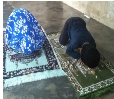
Gambar 6. Praktek gerakan sujud (dokumentasi penelitian)

Hasil dokumentasi selanjutnya disajikan pada gambar 5 dan gambar 6 yang menunjukkan bahwa anak melaksanakan shalat Ashar berjamaah dengan abangnya di rumah. Sepasang anak tersebut dititipkan kepada neneknya ketika orang tua mereka bekerja ke ladang. Diketahui bahwa si nenek tidak ikut shalat berjamaah dengan mereka karena kondisi nenek yang sudah tua sehingga lebih baik melaksanakan shalat sendiri, namun nenek tetap memantau gerakan shalat yang dilakukan oleh cucunya. Peneliti mengambil dokumentasi gambar 5 ketika anak melakukan gerakan ruku' pada rakaat kedua, dan gambar 6 ketika anak melakukan gerakan sujud pada rakaat yang sama. Dari dua gambar tersebut terlihat bahwa si adik (menggunkaan muken berwarna biru) mengikuti gerakan abangnya untuk melakukan ruku' dan sujud. Gerakan ruku' pada gambar 5 belum dilakukan dengan sempurna sebagaimana mestinya, namun gerakan sujud pada gambar 6 sudah dilakukan dengan tepat mengikuti aturan yang semestinya.