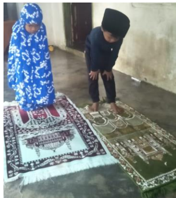
Gambar 5. Praktek gerakan ruku' (dokumentasi penelitian)