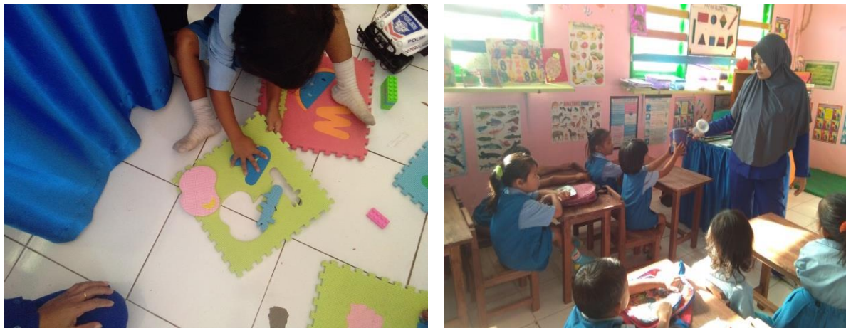
Gambar 2. Kegiatan mencocokkan pola dan huruf serta pengenalan alat peraga

didik harus tetap aktif meskipun tanpa bantuan alat permainan itu sendiri. Temuan tersebut didukung oleh pendapat Heryanti (2014) yang menyatakan bahwa metode bermain peran merupakan metode pembelajaran yang melibatkan interaksi antara dua siswa atau lebih tentang suatu topik dimana siswa memainkan peran sesuai dengan tokoh yang ia lakoni dalam hubungan sosial antar manusia setelah mendengar penjelasan guru tanpa harus mengalami latihan dan menghafal naskah sebelumnya. Hal ini juga ditegaskan oleh pendapat Wardah Anggraini (2019) yang menyatakan bahwa metode bermain peran ( role playing ) merupakan metode pembelajaran yang digunakan untuk meningkatkan perkembangan berbagai aspek usia dini salah satunya adalah perkembangan kognitif.