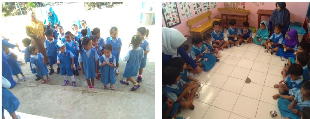
Gambar 3: Kegiatan berbaris sebelum masuk kelas (pembiasaan) dan belajar makan bersama