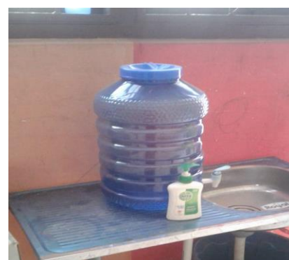
Gambar 5. Sabun dan tempat Cuci tangan