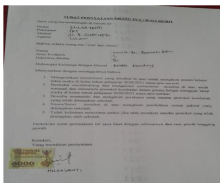
Gambar 3. Orangtua menandatangani surat pernyataan

Pelaksanaan pembelajaran tatap muka yang telah dirancang oleh lembaga PAUD harus mendapatkan izin dari orangtua peserta didik. Sebagaimana yang dikemukakan salah seorang guru bahwa orangtua peserta didik harus setuju dengan pelaksanaan pembelajaran tatap muka dan menandatangani surat pernyataan (Wawancara, Ibu guru M, 10 Desember 2020). Respon orangtua peserta didik terkait dengan pelaksanaan pembelajaran tatap muka ini sangat setuju, sesuai hasil wawancara dengan salah seorang orangtua bahwa kami sangat setuju dengan pelaksanaan pembelajaran tatap muka di sekolah dengan penerapan protokol kesehatan (Wawancara ST, 10 Desember 2020). Hal lain diungkapkan oleh orangtua peserta didik bahwa kami senang jika pembelajaran tatap muka lagi, anak-anak kami sudah lama belajar di rumah, kami takut anak kami jenuh dalam belajar karena anak-anak belajar sendiri di rumah. Olehnya itu kami menandatangani surat pernyataan kesediaan untuk anak-anak belajar tatap muka lagi di sekolah (Wawancara H, 10 Desember 2020). Surat pernyataan kesediaan orangtua disiapkan oleh lembaga PAUD beserta materai untuk ditanda tangani oleh orangtua sebagaimana terlihat pada gambar 3, surat pernyataan kesediaan orangtua yang ditanda tangani di atas materai sebagai salah satu syarat untuk pembelajaran tatap muka.