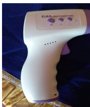
Gambar 4. Alat Pengukur Suhu