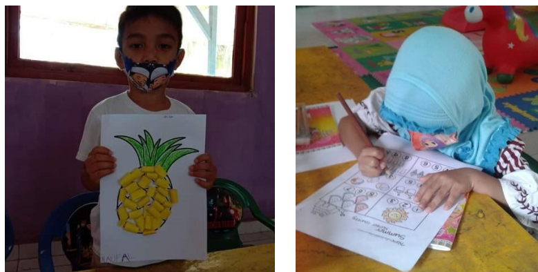
Gambar 2. Peserta didik menggunakan masker dalam pembelajaran tatap muka.

masyarakatnya telah menggunakan masker saat keluar dari rumah, meskipun masih ada sebagian kecil masyarakat yang belum menggunakan masker. Dibutuhkan kesadaran yang tinggi untuk sama-sama saling membantu memutus mata rantai penularan Covid-19. Penggunaan masker dimasa pandemi ini sangat penting untuk melindungi diri dan orang lain (Pratiwi, 2020). Penggunaan masker kepada peserta didik sudah dibiasakan oleh guru dan orangtua ketika peserta didik mengumpulkan tugas di sekolah yang diberikan oleh guru sebagaimana terlihat pada gambar 2 peserta didik menggunakan masker dalam pembelajaran tatap muka.